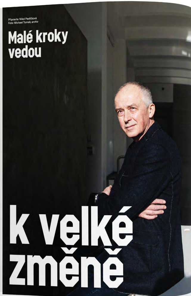
Malé kroky vedou